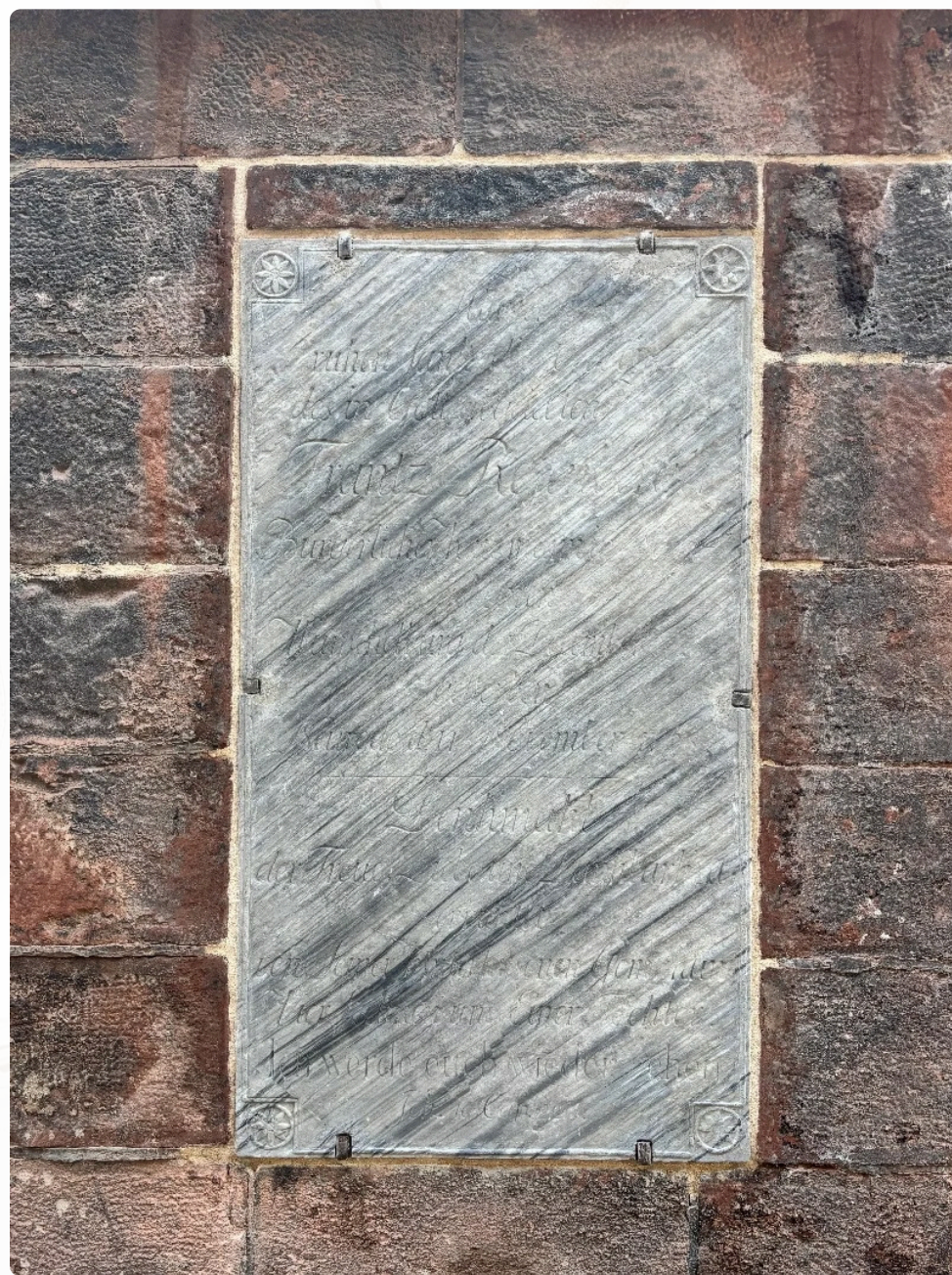
Epitafium Frantza Rosenberga po provedení konzervačních prací