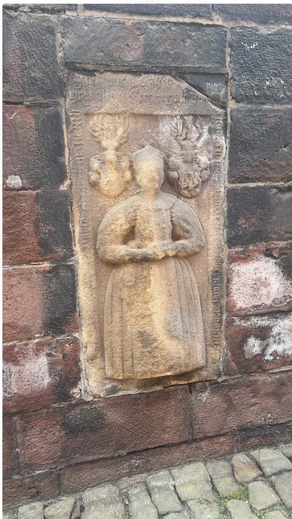
Epitafium Judyty před provedením restaurátorských prací

Navzdory času a erozi zůstávají detaily obličeje a držení postavy stále čitelné, což umožňuje ocenit uměleckou zručnost kameníka.