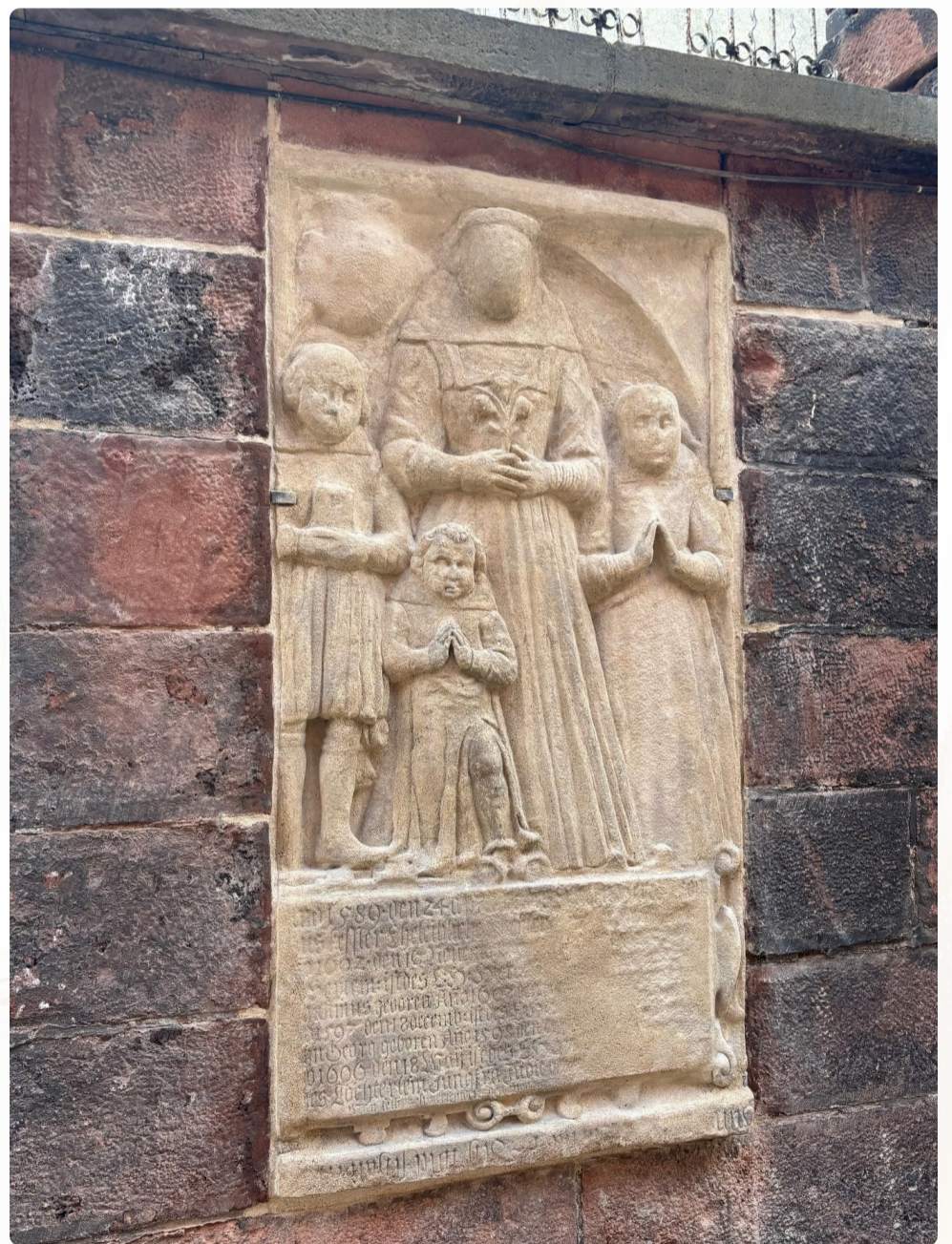
Epitafium dětí Hieronima Kesslera po provedení konzervačních prací