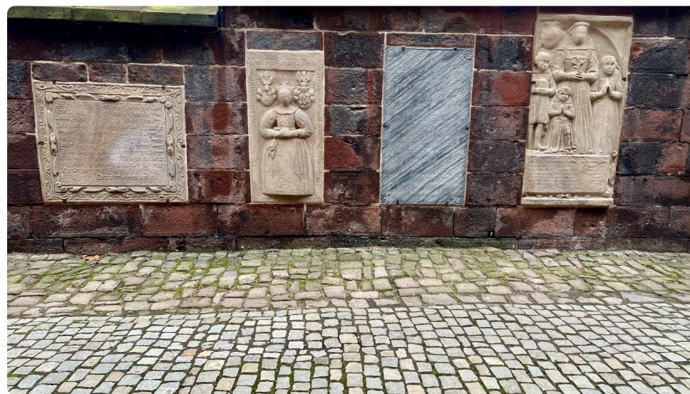
Základní deska a epitafy po provedení konzervačních prací