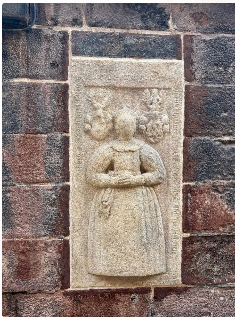
Epitafium Judity po provedení restaurátorských prací