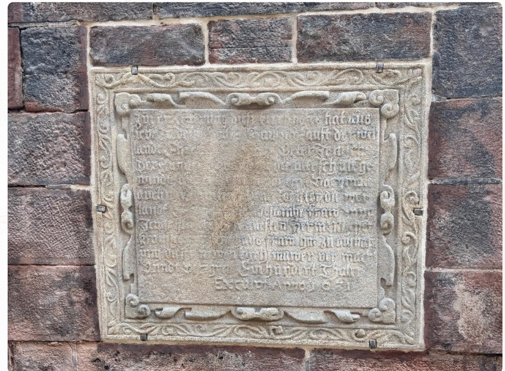
Zakládací deska po provedení restaurátorských prací