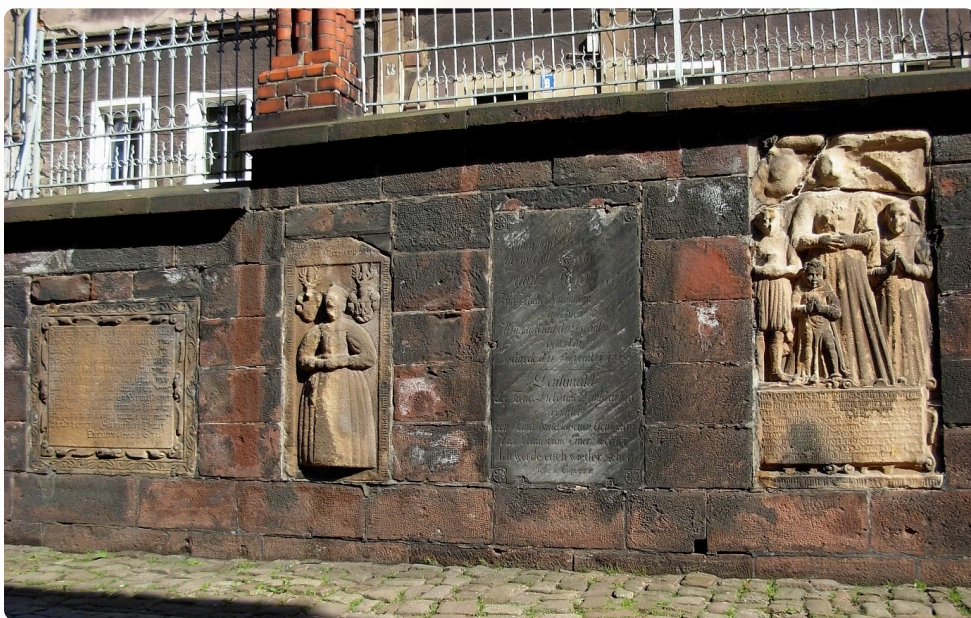
Základní deska a epitafy před provedením konzervačních prací