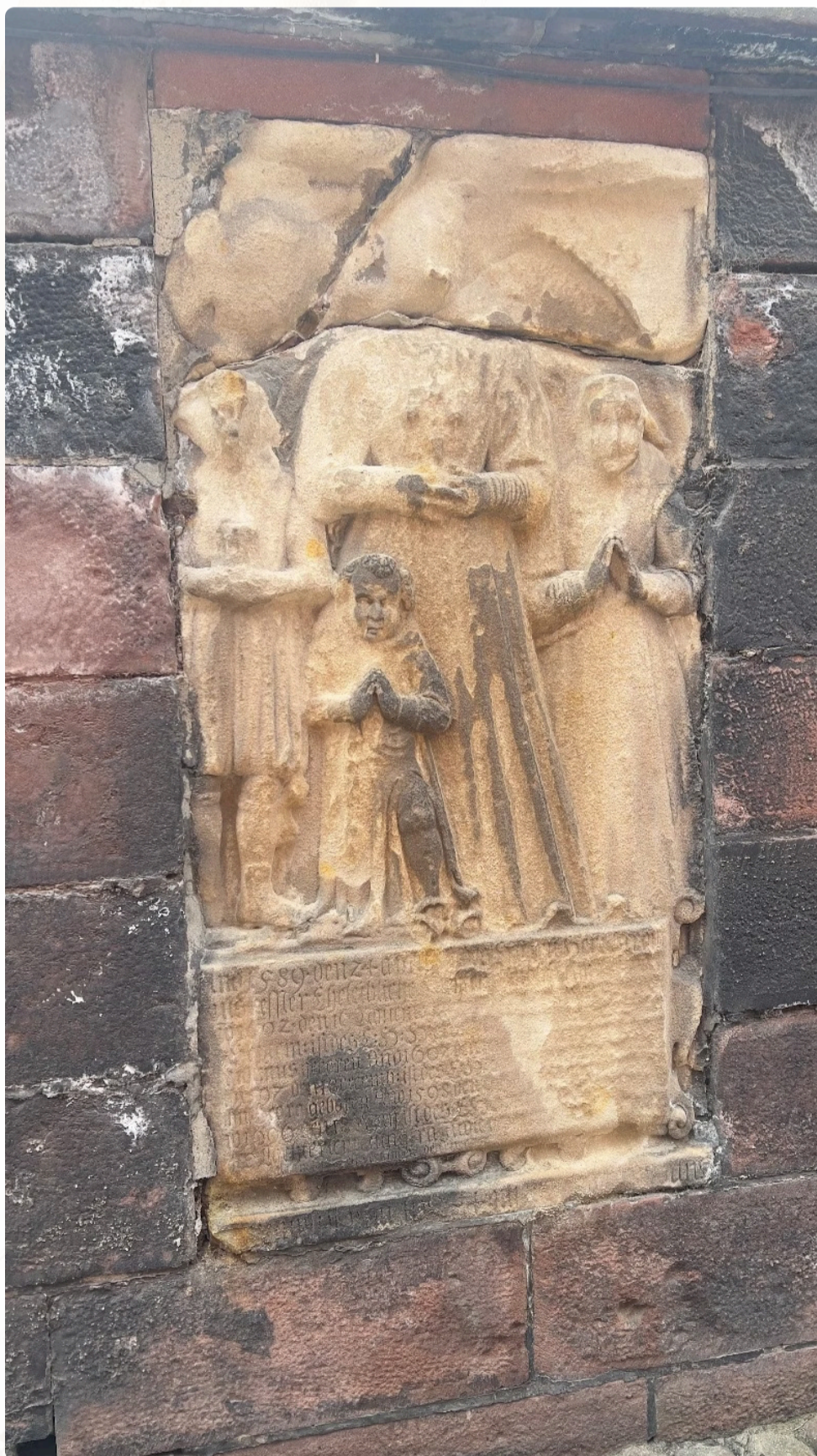
Epitafium Děti Hieronima Kesslera před provedením restaurátorských prací

Navzdory znatelným stopám eroze si epitaf zachoval mimořádnou historickou i uměleckou hodnotu.